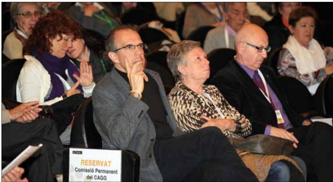
Un moment de la convenció "Les veus de la gent gran de Barcelona".