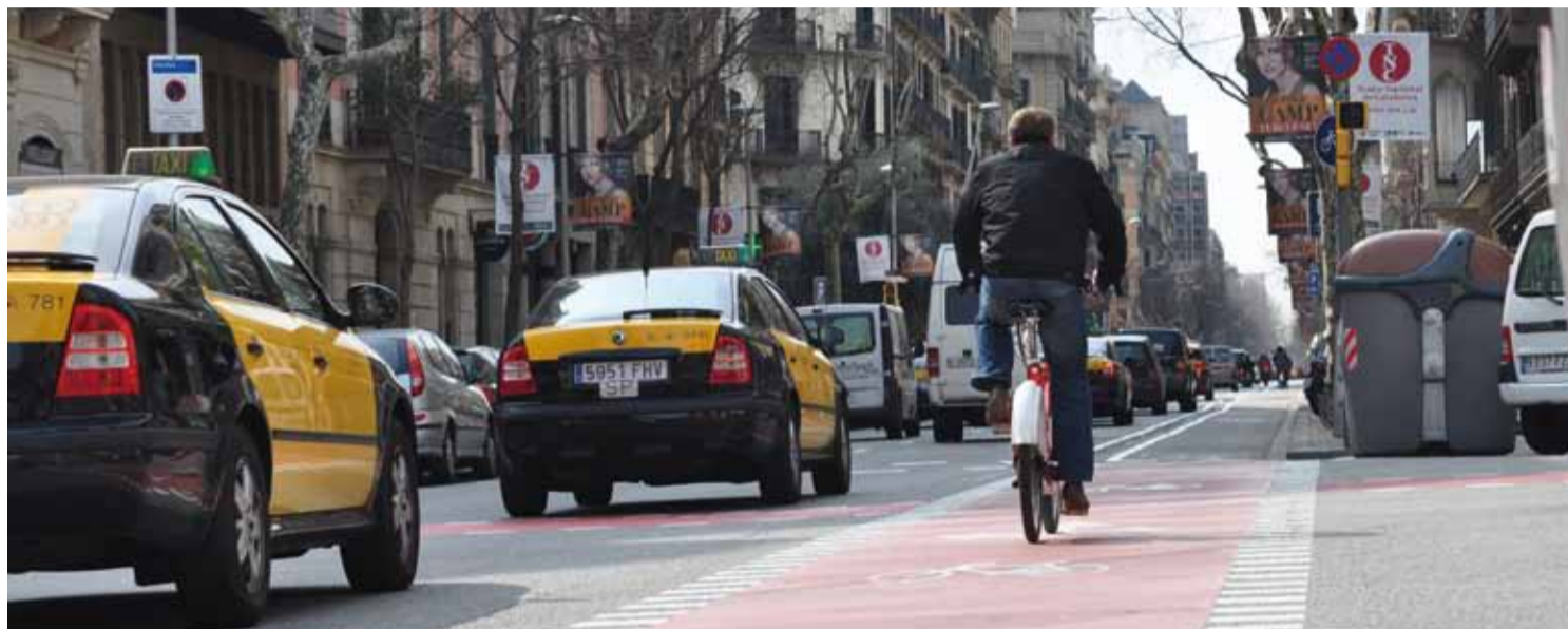
Un ciclista va pel carril bici del carrer Girona, un dels que ha estrenat semàfor per a bicicletes.

A més, desplaçar-se amb la bici és sostenible també perquè no ocupa espai, ni al carrer ni per a l'usuari, que no ha de buscar un gran lloc per aparcar-la. Precisament la manca d'espai és un problema afegit per als conductors, perquè hi ha molts