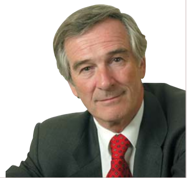
Xavier Trias i Vidal de Llobatera CiU