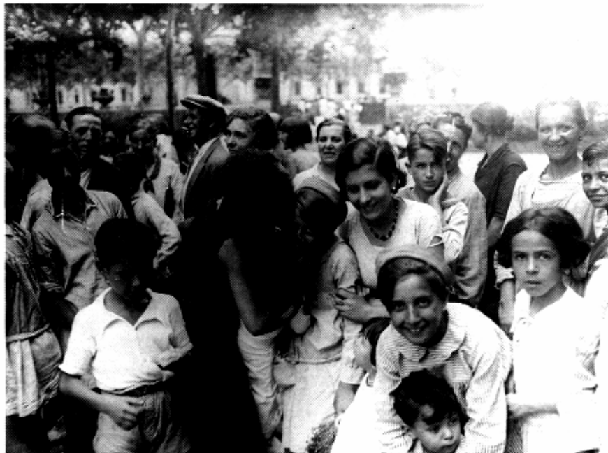
Institut Municipal d'Història

Els "xiringuitos" de la Barceloneta eren un punt de trobada entre ciutadans de les més diverses procedències socials. La urbanitat és, en primer lloc, la qualitat de saber viure en grup respectant la personalitat dels altres.