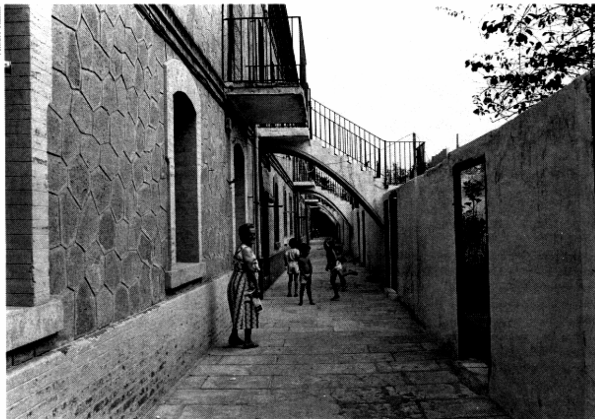
Una imatge del desaparegut passatge Gasòmetre. Els canvis urbanístics experimentats per Barcelona han de promoure, alhora, una modificació del tarannà de la societat que hi viu.